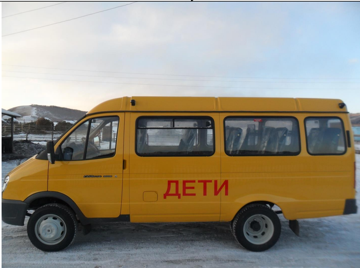
4. Вид сбоку справа